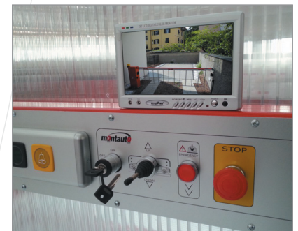
Konsole mit Kamerasystem

Das SPB-System kann mit einem Videosystem zur Beobachtung der äußeren Oberfläche ausgestattet werden.